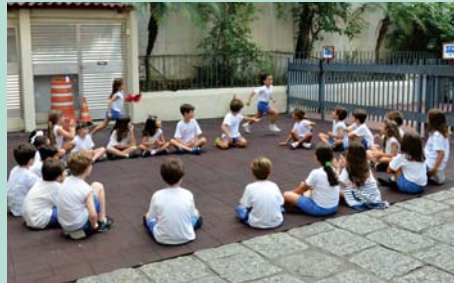
2º ano (EFI) em atividade ao ar livre.