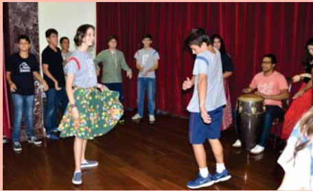
8º ano dançando Jongo em aula de Música