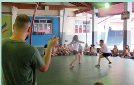
Ensino Médio tendo aula de Capoeira.