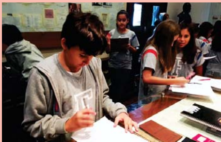
6º ano (EFII) estudando fontes históricas no CDM.