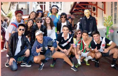
3ª série (EM) em Dia temático (Décadas)