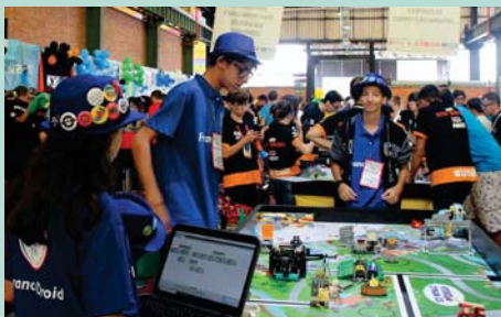
Torneio Regional de Robótica