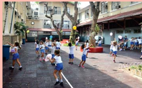
1º ano (EFI) em atividade com balões.