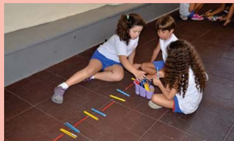
2º ano (EFI) aprendendo matemática na prática.