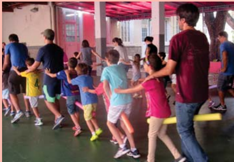
Sábado Esportivo (EFI)