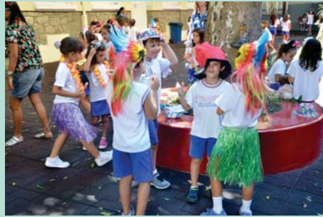
Carnaval no recreio - 1º ano (EFI)