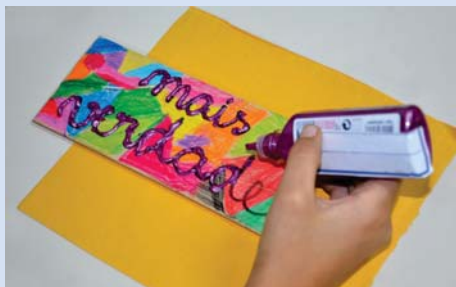
Atividade em Artes: “Queremos mais...”