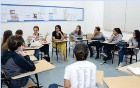
Cine Franco em debate.