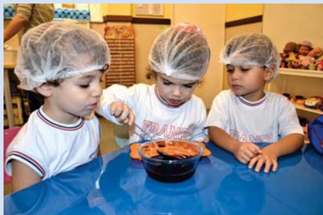
Culinária no Integral (Maternal).