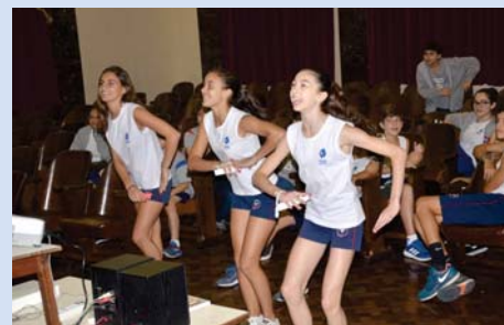
Olimpíada de Educação Física (EFII).