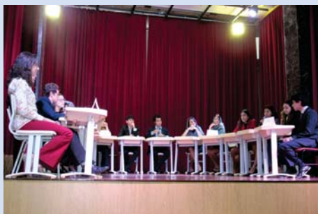
Debate com alunos caracterizados (2ª série EM).