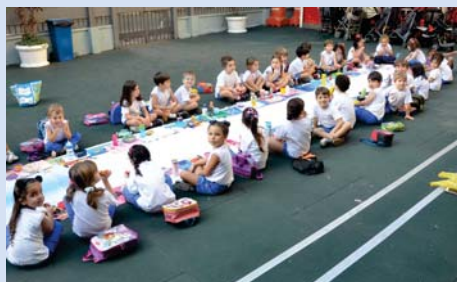
Piquenique do Pré I.