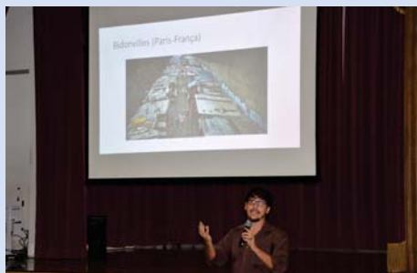
Palestra para os alunos do 4º ano (EFI).