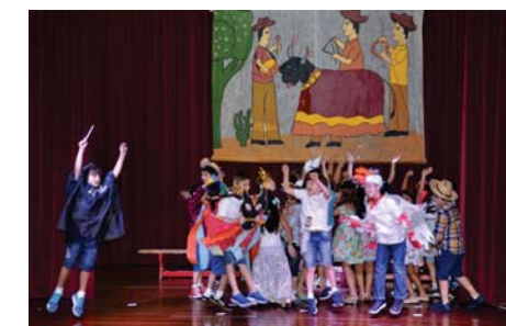
Festa do Boi - 1º ano (EFI)

Pioneiro da Pediatria Integral, ele apresentou uma visão inovadora da saúde, que permite o engajamento de indivíduos e organizações em uma só cidade mais saudável e sustentável.