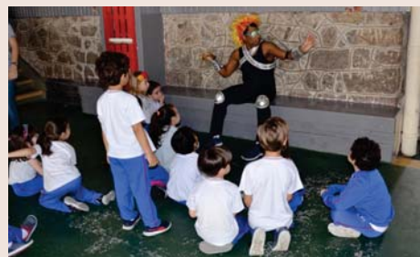
Alunos do Integral brincando com o "Super Fogo".