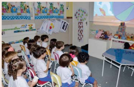
Cinema com pipoca para o Maternal I.