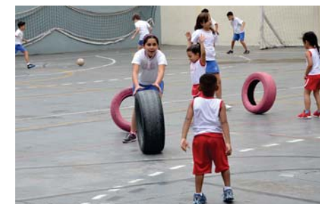
Alunos do EFI brincando com crianças da Creche Sant'Anna.