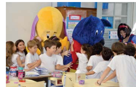
"Visita" especial dos mascotes do LIV (EFI).