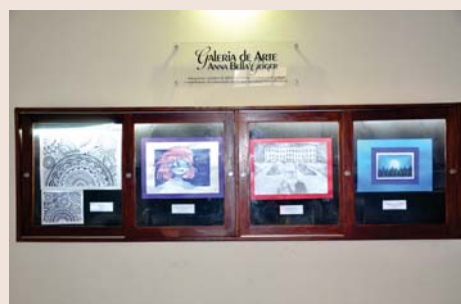
Talentos na "Galeria de Artes" (EFII e EM).