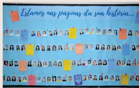
Mural comemorativo: Dia dos Professores.