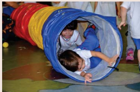
Maternal I "deitando e rolando" na brincadeira.