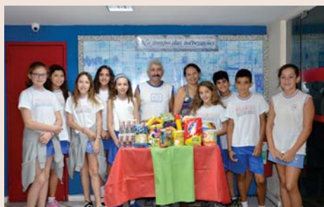
Projeto social (EFI): entrega de doações.