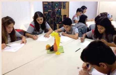
Desenho de observação na aula de Artes. (6º ano - EFI)