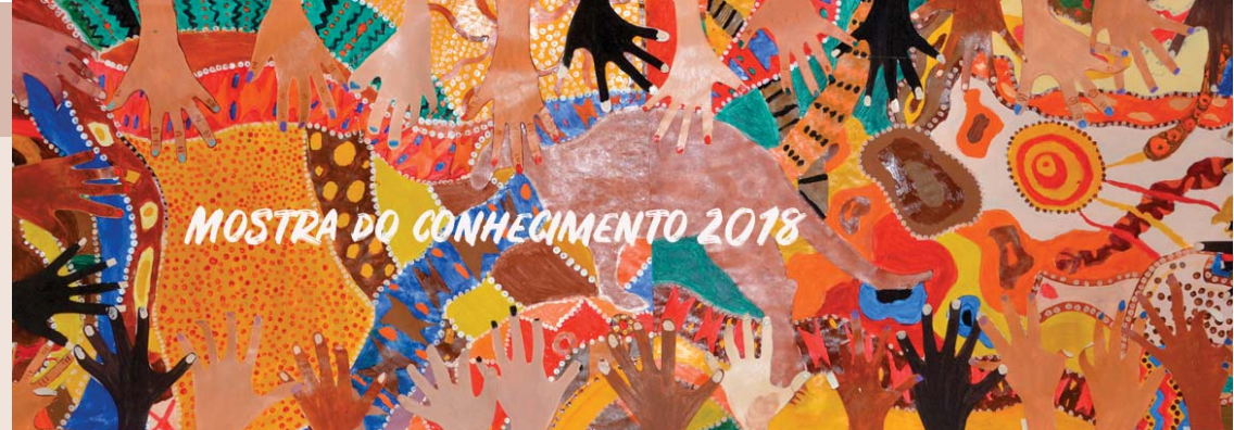
Painel de Artes do 6º ano (detalhe): "Nós, humanos, pelos cinco continentes".

Nossos pequenos eleitores se prepararam para tomar suas decisões, apreciando muito discutir sobre as regras e as propostas dos animais para proteger e preservar a natureza. Foi uma atividade repleta de consciência ambiental e muito respeito ao próximo! Elas adoraram!"