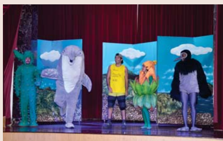
Peça teatral "O fundo do mar" para a EI.