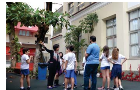
5º ano aprendendo sobre o Colégio (Francês/CDM).