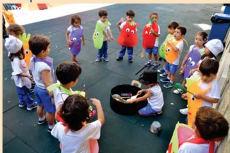
Alunos do Mat II são os "ingredientes" de uma sopa.