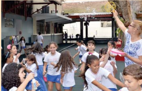
2º ano (EFI): atividade com bolhas de sabão.

“Estamos de luto pelo Museu Nacional!”, esse foi o tema da aula no dia seguinte ao triste acontecimento que surpreendeu a todos. As turmas de 4º ano do Ensino Fundamental reuniram-se em grupos para fazer uma redação. Nesse dia, reforçamos a importância de as famílias visitarem museus; afinal, como conhecer o presente se não valorizamos o passado?