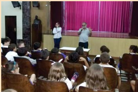
Palestra para o 3º ano (EFI): A história do voto.