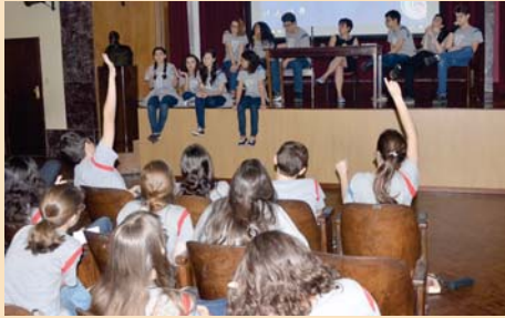
Alunos do 9º ano em debate (História).