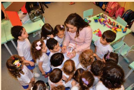
Maternal II recebe a visita de uma dentista.