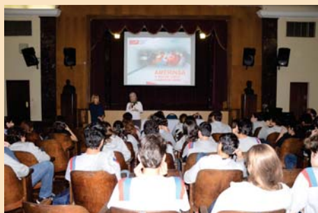
Palestra para o EM:

Ins tut Na onal des sciences appliquées (Lyon)