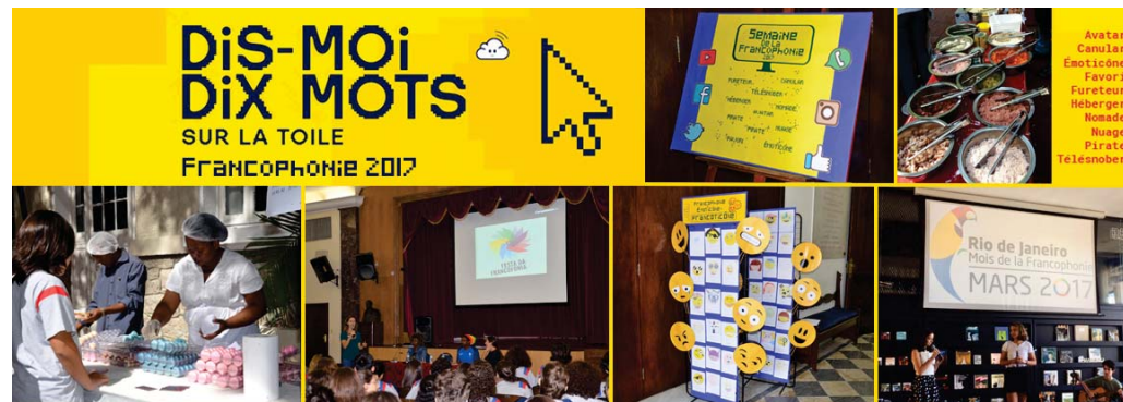
Semana da Francofonia 2017 (EFII e EM)

Como parte das atividades comemorativas do Dia da Boa Ação, em 02 de abril, os alunos da equipe de robótica FrancoDroid realizaram, na segunda e na terça-feira, 27 e 28 de março, uma recreação dirigida com lego para os alunos do Pré II. E como as crianças a aproveitaram!