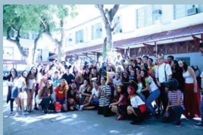
Dia temático: fantasias - 3ª série (EM)