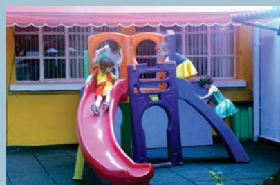
Diversão no Parquinho (EI)