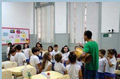
"C'est Carnaval!" - Francês (EF1)