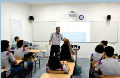
Palestrante da Universidade Santa Úrsula (EM)