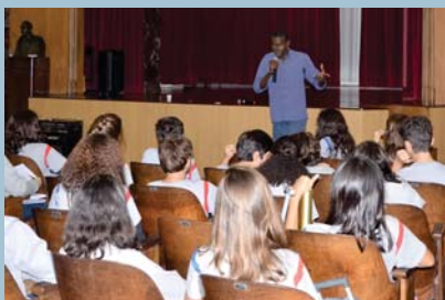
Palestrante sobre Refugiados - 8º ano (EFII)