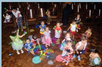
Carnaval no Maternal I (EI)