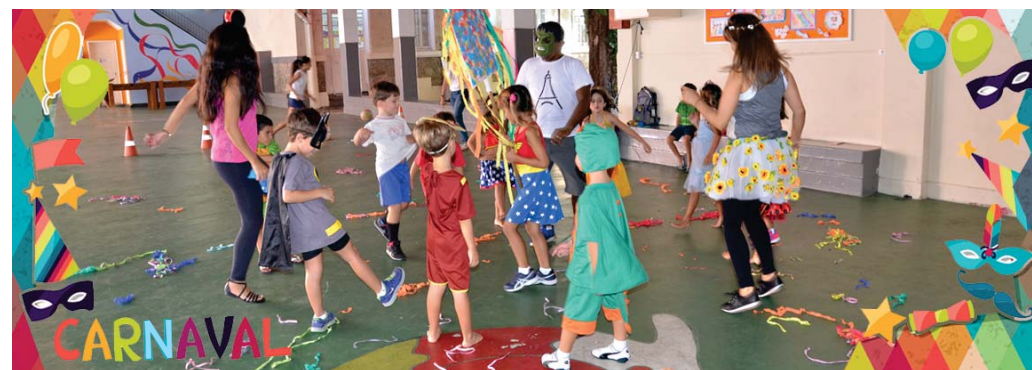
Carnaval no Integral - Pré II (EI)

Na Educação Infantil, as crianças, fantasiadas, brincaram, desfilaram e dançaram músicas do nosso animado Carnaval.